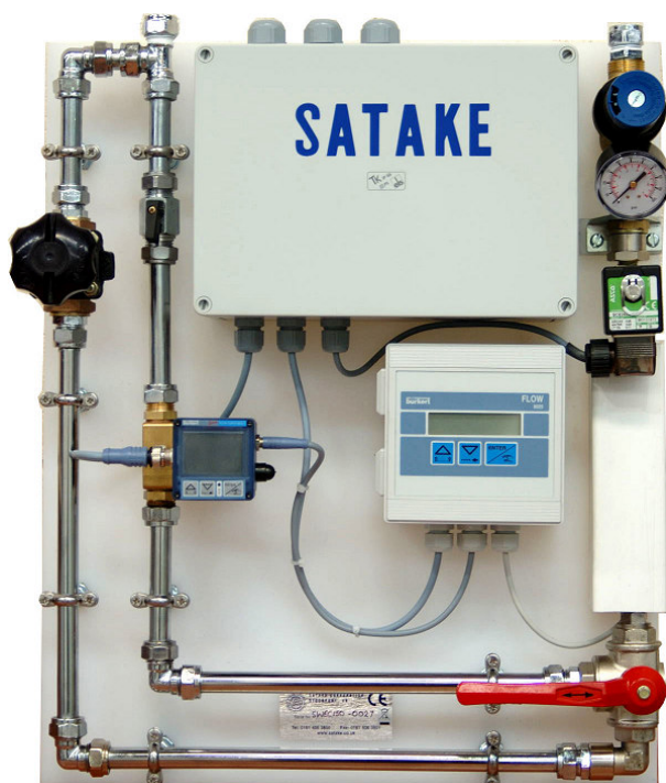
Panneau SWEC avec régulateur litres/min

Le panneau de commande de l'eau SWEC régule et surveille électroniquement le débit de l'eau.